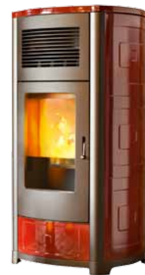
Piecyk na pelety